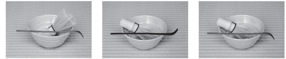
A 類型 (Ud)

同様に、他の項目についてもアルファベットによる類型化をおこなう。それらをならべるならば、各流派の点前はアルファベットの記号列として表現されることとなる。そこで 2 つの流派のアルファベットの記号列を比較して、相互の一致不一致を調べ、一致している項目の占める率を算出した。これを試論では「一致率」とよぶこととした。